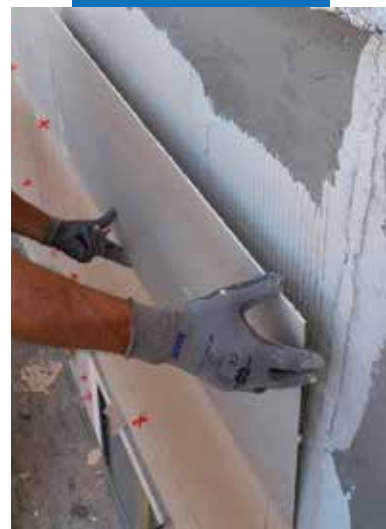
Укладка тонкослойного керамогранита на фасады снаружи помещений