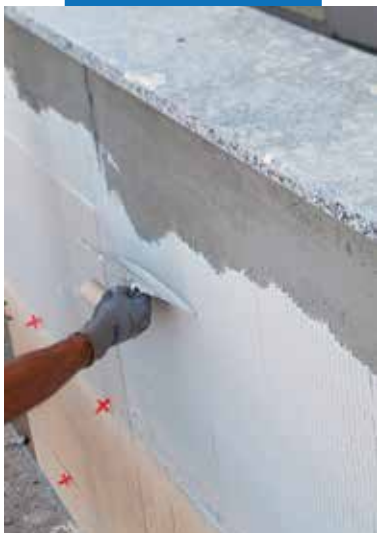
Укладка на фасады помещений: нанесение клея на основание