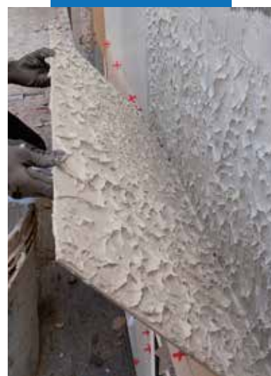
Проверка контакта тыльной стороны плитки с основанием фасада снаружи помещений