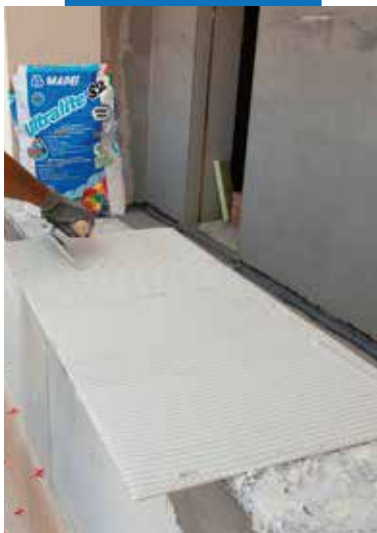
Нанесение клея на тыльную сторону плитки