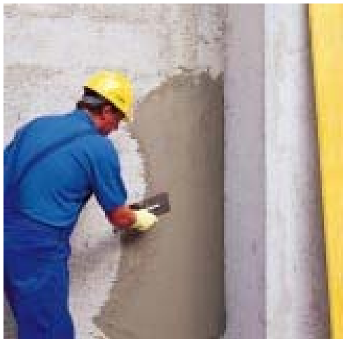
нанесение MONOFINISH шпателем